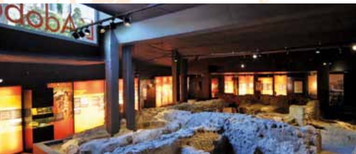
La entrada de "l'Adoberia" en la Plaza de la Iglesia.

Hoy en día forma parte de la Xarxa d'Adoberies Històriques de Catalunya integrada por la Adoberia de Cal Granotes del Museu de la Pell d'Igualada i Comarcal de l'Anoia, la Adoberia del Molí del Codina en Tàrrega, el Museu de l'Art de la Pell de Vic, las Adoberies de Lleida y la misma Adoberia de Granollers. Unos espacios patrimoniales que permiten una lectura amplia y completa de la evolución del trabajo de la tenería en Catalunya desde los períodos preindustriales hasta la época contemporánea.